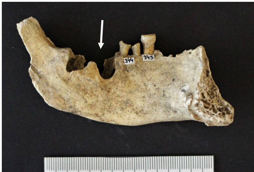
Figure 9 : Sclaigneaux, mandibule 61 : atteintes osseuses au niveau des racines des molaires