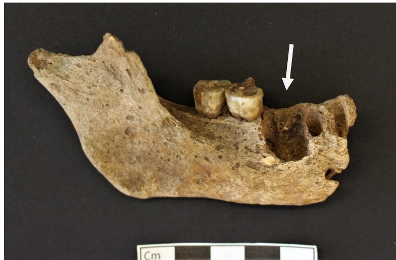
Figure 4: Caverne M, mandibule 11 : atteinte pathologique de l'os