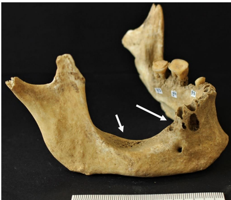
Figure 7: Sclaigneaux, mandibule 20 : alvéoles résorbées suite à la perte de dents et aspects pathologiques