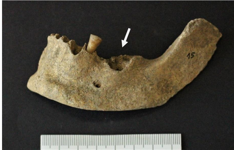
Figure 3 : Caverne B, mandibule 15 : creusement pathologique