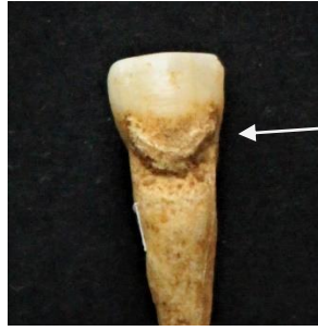
Figure 10 : Burnot, 2 I présentant du tartre