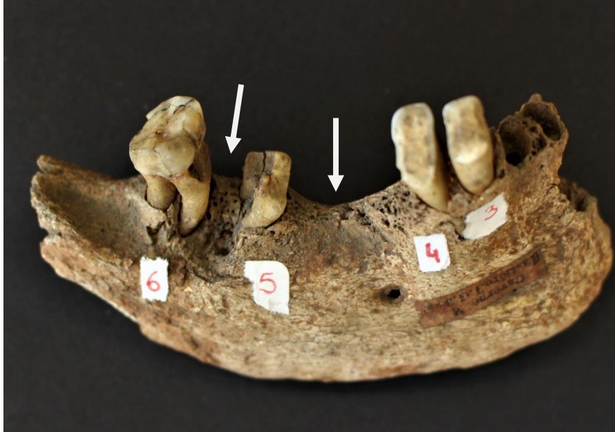
Figure 1 : Caverne M, mandibule 6 : présente des alvéoles en cours de fermeture suite à la perte de dents. Aspect pathologique lié à une forte carie sur la 1M