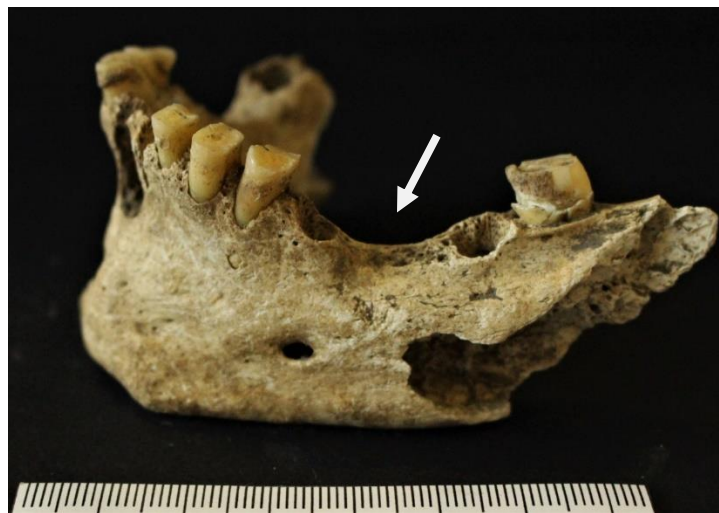
Figure 6: Sclaigneaux, mandibule 13, plusieurs atteintes pathologiques de l'os, résorption des alvéoles suite à la perte de dents