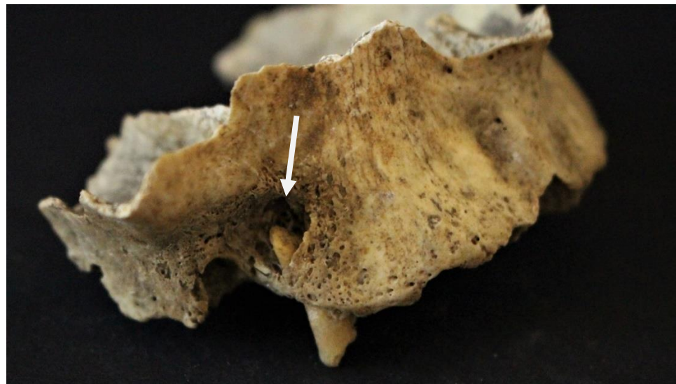
Figure 8 : Sclaigneaux, maxillaire 114 : atteintes osseuses au niveau de plusieurs racines dentaires