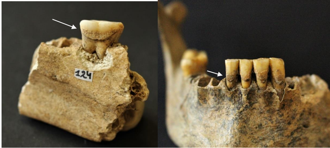
Figure 11: Sclaigneaux, mandibules 59 et 15 présentant du tartre