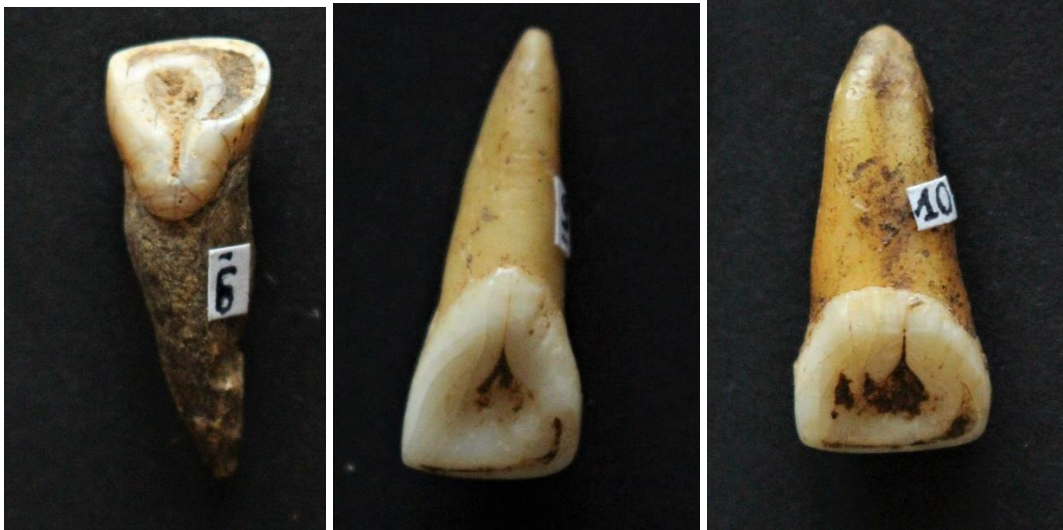
Figure 12 : Burnot, incisives en pelle, double pelle et "semi-barreled"