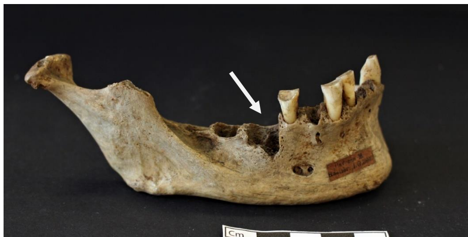
Figure 5 : Caverne M, mandibule 8 : atteinte pathologique de l'os alvéolaire