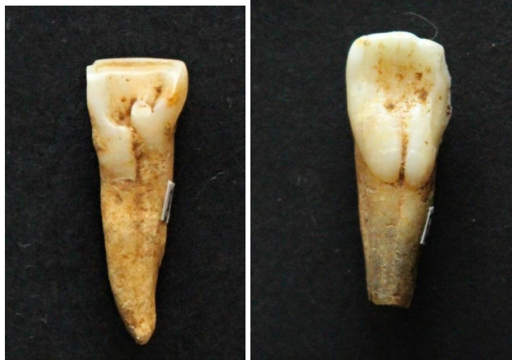
Figure 13 : Burnot, incisives avec sillons d'interruption