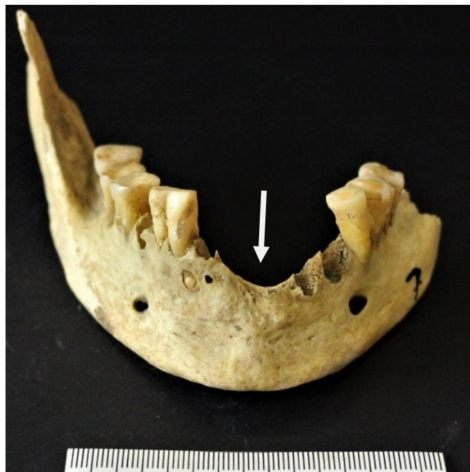
Figure 2 : Sclaigneaux, mandibule 7 : résorption des alvéoles suite à la perte de dents