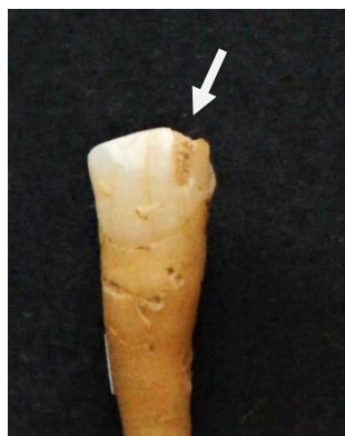
Figure 14: Burnot, potentiel marqueur d'activité para masticatrice