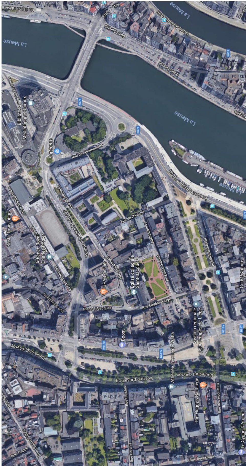
Annexe 1 - Plan de Liège centré sur le site du Grand Séminaire (GoogleMaps, 2018)